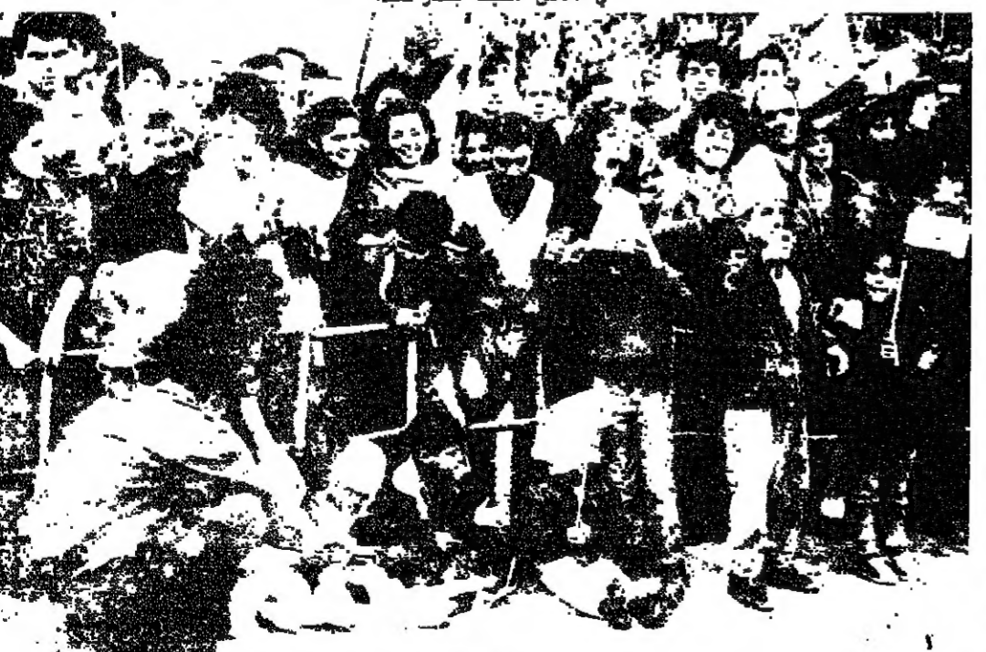
من كل الاعمار